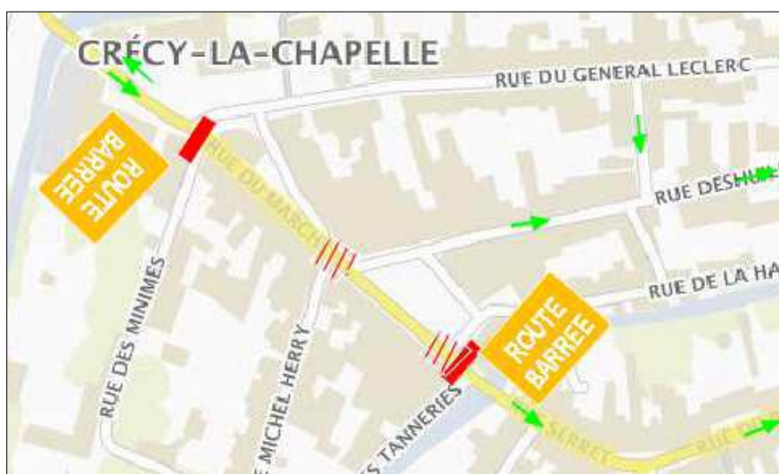
RUE DU MARCHE Rue barrée du 27 au 31 août 2018