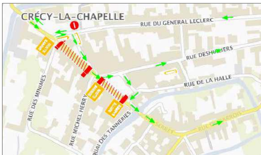
RUE DU MARCHE Du 16 juillet au 24 août 2018