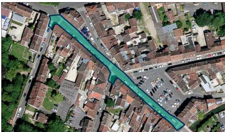
RUE DU MARCHE Du 16 juillet au 31 août 2018